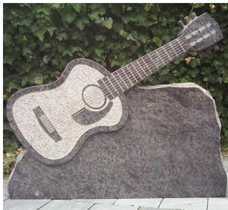
Gitaar uitgehakt i.c.m. RVS snaren