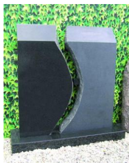
Monument van Zwart Graniet waarvan de linkerzijde gepolijst en de rechterzijde gezoet is

Bij zoeten (matglans) wordt de laatste fase van het schuurproces voltooid en geeft een matglans. Na het zoeten kan met een polijstschijf het natuursteen gepolijst worden (hoogglans).