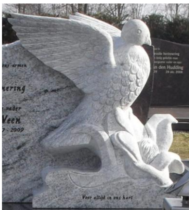
Duif en bloem uitgehakt

Ieder gewenste sculptuur kan in steen gehakt worden, bijvoorbeeld n.a.v. een foto of bepaald voorwerp.